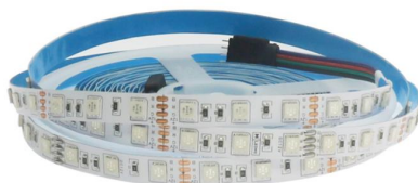
Tabla de Referencias